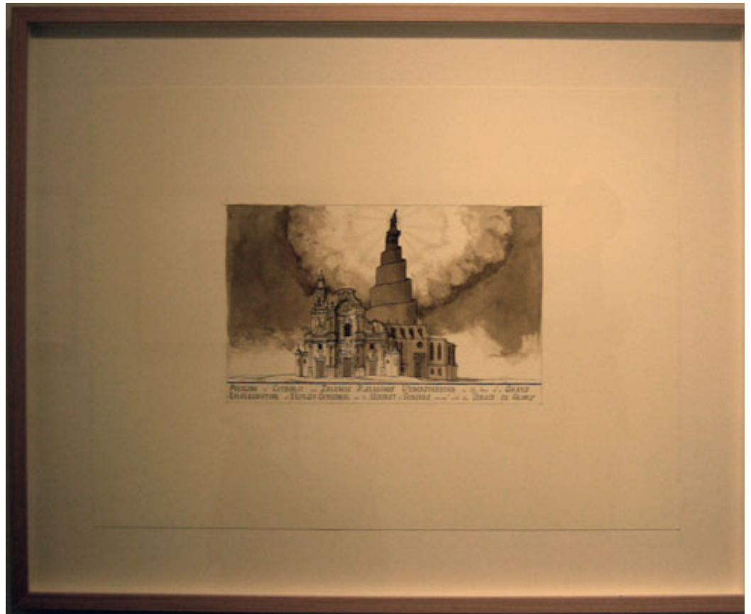
Pablo Bronstein (1977, Argentinië), Islamic Culture in Southern Spain – 1000 years of