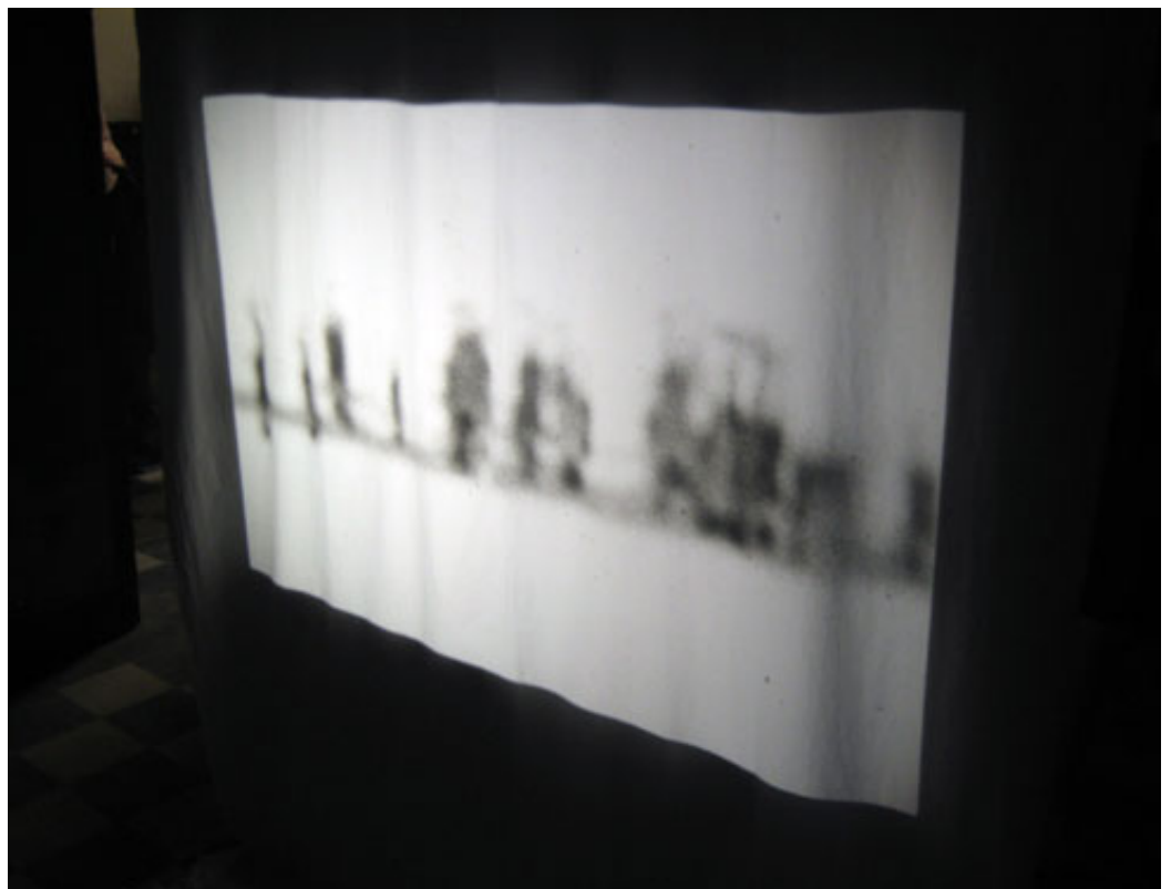
Céline Condorelli (1974, Frankrijk), There is nothing left , 2010