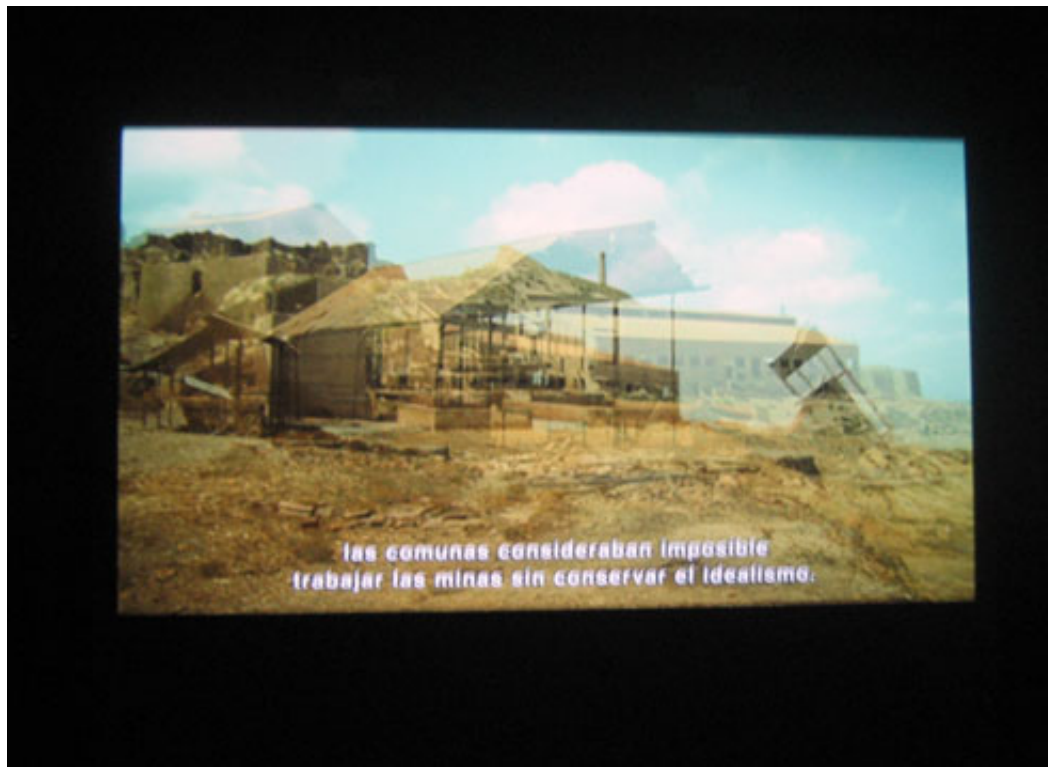
Stefanos Tsivopoulos (1973, Tsjechië), AmnesiaLand , 2010

las comunas consideraban imposible trabajar las minas sin conservar el idealismo.