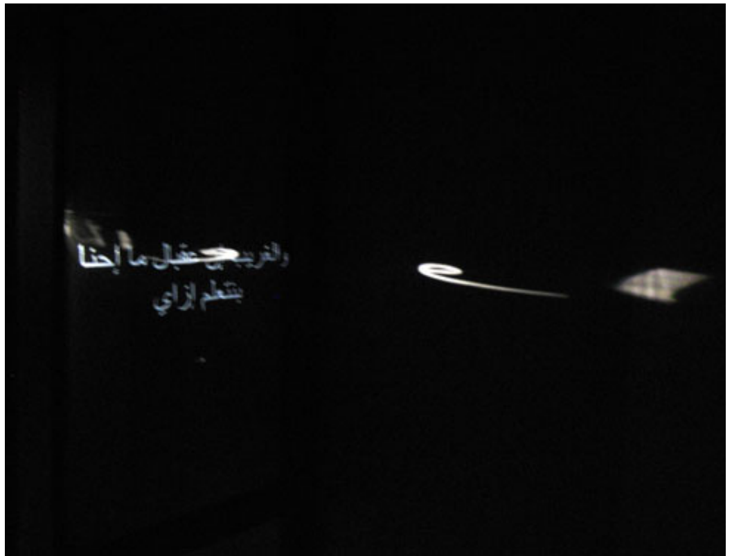
Céline Condorelli (1974, Frankrijk), There is nothing left , 2010